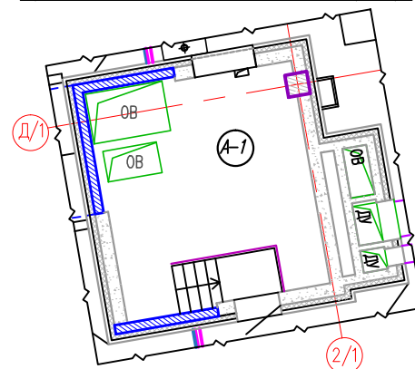
Фрагмент плана на отм. +29.400 в осях 2/1-Д/1